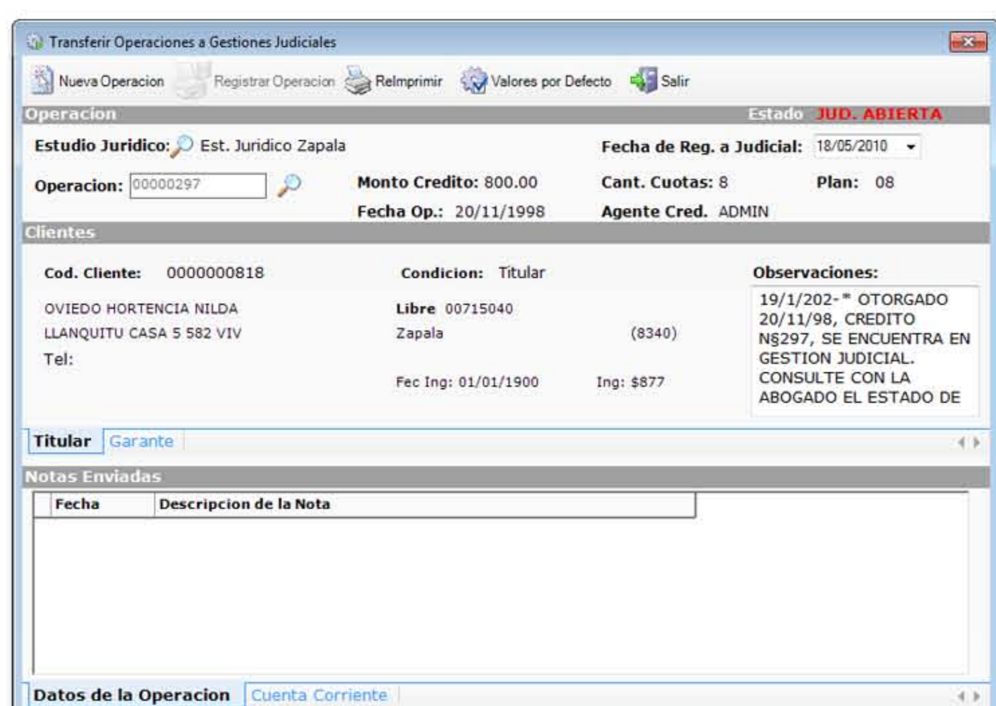
Transferencias de Operaciones a Gestiones Judiciales

Cuando un estudio rinde la deuda cobrada, se cancela parcial o total la cuenta corriente del Cliente. Estas rendiciones quedan registradas para controlar el seguimiento que realiza un estudio jurídico con los clientes deudores.